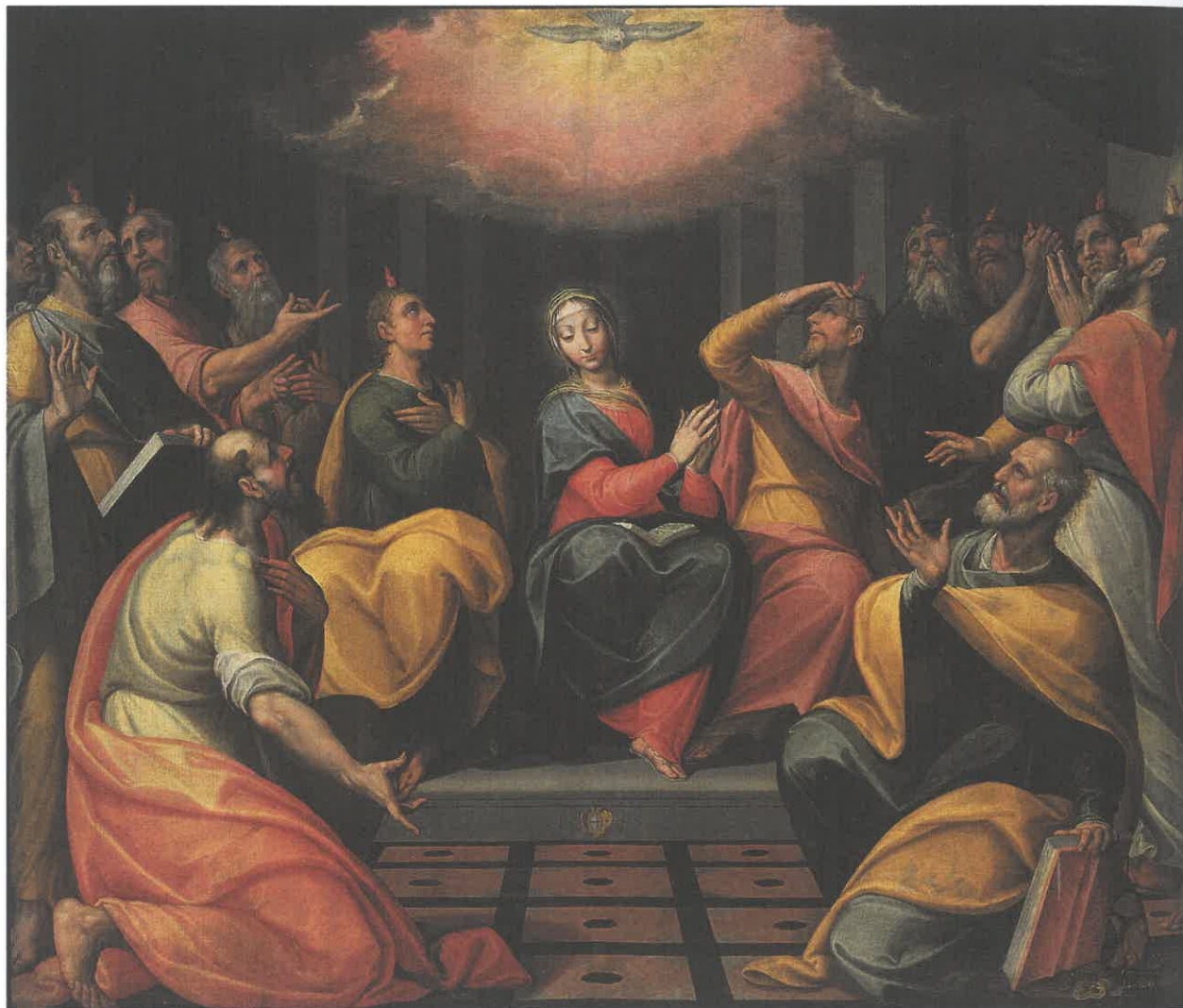
Giovanni Mauro della Rovere (v. 1575–1640) La descente de l'Esprit Saint , v. 1610–30, huile sur toile.

ils _ _ _ _ _ . Avec Marie, ils sont dans l'attente.