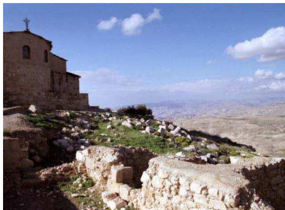
Le mont Nébo