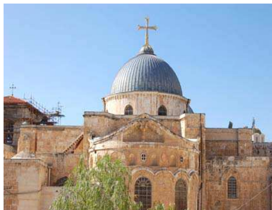
Jérusalem : Saint Sépulcre