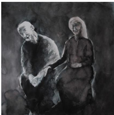
Zacharie et Elisabeth

Les couples de l'Ancien Testament sont le sujet d'un tableau chacun, et deux tableaux pour Marie et Joseph, à travers l'Annonciation et la Visite de l'ange dans le sommeil de Joseph. Le dernier et cinquième tableau concerne l'incarnation du Christ, le fruit vivant de la Promesse.