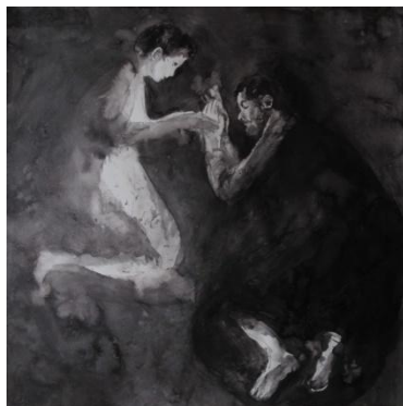
La visite de l'ange à Joseph