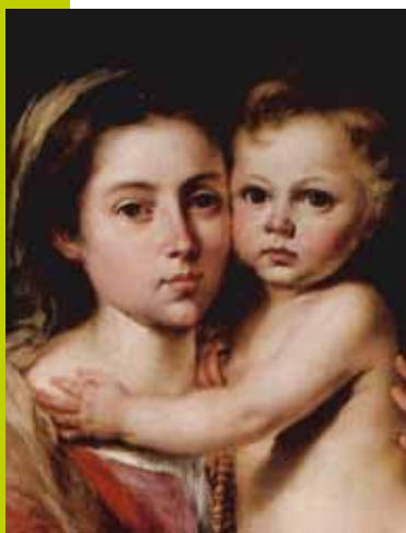
La vierge au rosaire, Murillo (1645)