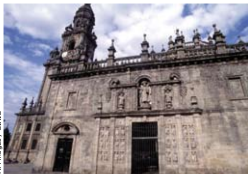
A. Pinoges / CIRIC

marquants de l'Ancien et du Nouveau Testament. Sur place, nos guides ont su nous présenter les merveilles de San-Miguel de Estella, San-Domingo de la Calzada, Burgos, Léon, Astorga, Lugo... Nous avons participé à la messe des pèlerins de Santiago, la ville de granit, but ultime du voyage, dans lequel chacun avait mis ses vœux