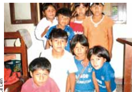
Les enfants de l'association en Bolivie.

Renseignements : www.acisjf-int.org . Comité national français et comité parisien de l'ACISJF-INVIA : 63 rue Monsieur-le-Prince 75006 Tél. : 01 44 32 12 90 acsjf.paris@wanadoo.fr